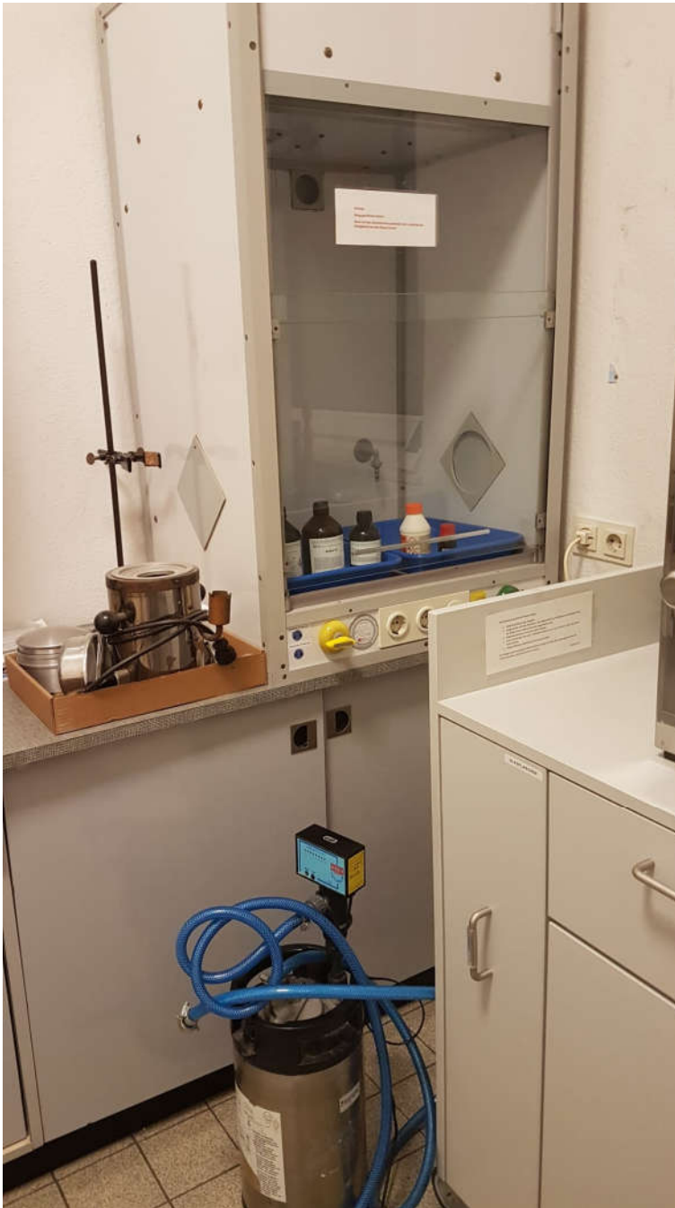
Rezeptur-Schrank, Trockenschrank gehört an die Wand

Bitte nehmen Sie bei Interesse direkten Kontakt mit den in dieser Datei genannten Ansprechpartnern auf. Kammern und Verbänden liegen über die in dieser Datei veröffentlichten Informationen hinaus keine weiteren Infos vor.