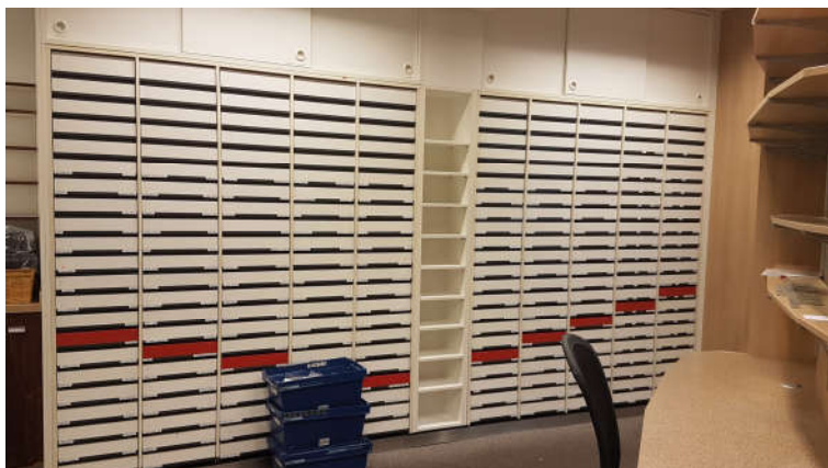
Teil der alten Labor Möblierung

Bitte nehmen Sie bei Interesse direkten Kontakt mit den in dieser Datei genannten Ansprechpartnern auf. Kammern und Verbänden liegen über die in dieser Datei veröffentlichten Informationen hinaus keine weiteren Infos vor.